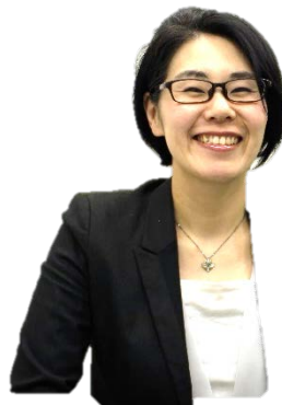
NSA高等学院 コミュニケーション講師 特別顧問 一般社団法人日本ダイバーシティ推進協会 特別顧問

グレーゾーンの発達障がい当事者として、自身のうつ病、自律神経失調症、パニック障がい、の紆余曲折の経験から、コーチングを通してうつ病や発達障がいの方の就労支援を目指すコーチングインストラクター。具体的なコミュニケーションや行動のノウハウを当事者・支援者双方の視点から希望の「光」として提供している。